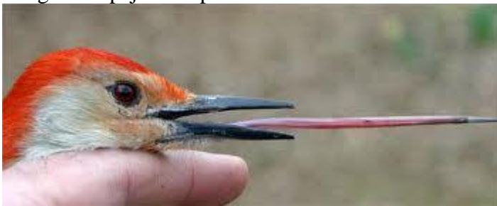
Lengua del pájaro carpintero